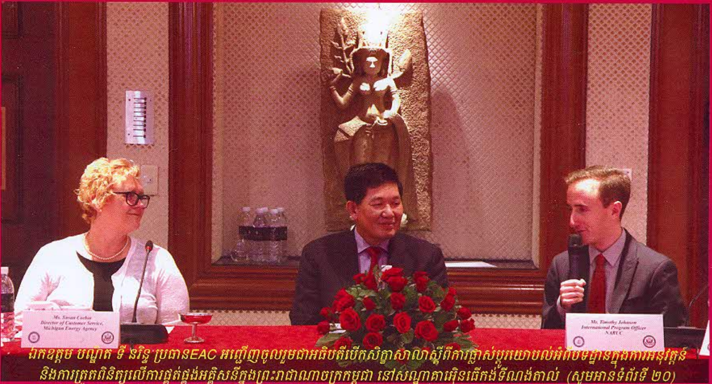
ឯកឧត្តម បណ្ឌិត ទី នរិន្ទ ប្រធានSEAC អញ្ជើញចូលរួមជាអធិបតីបើកសិក្ខាសាលាស្តីពីការផ្លាស់ប្តូរយោបល់អំពីបទដ្ឋានក្នុងការអនុវត្តន៍ និងការត្រួតពិនិត្យលើការផ្គត់ផ្គង់អគ្គិសនីក្នុងព្រះរាជាណាចក្រកម្ពុជា នៅសណ្ឋាគារអ៊ិនធើកង់ទីណង់តាល់ (សូមអានទំព័រទី ២០)