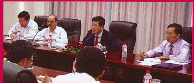
កិច្ចប្រជុំពិភាក្សាការងារជាមួយក្រសួងថាមពល និងប្រទេសឡាវ (សូមអានទំព័រទី ១៩)