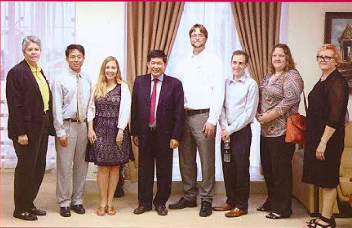
ដំណើរទស្សនកិច្ចរបស់គណៈប្រតិភូសមាគមបញ្ញត្តិកអគ្គិសនី សហរដ្ឋអាមេរិក មកកាន់ទីស្នាក់ការអាជ្ញាធរអគ្គិសនីកម្ពុជា (សូមអានទំព័រទី ២០)